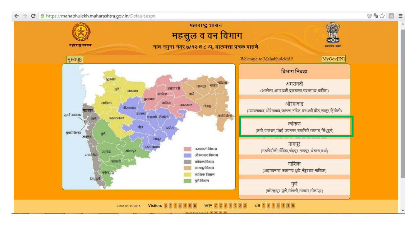
Page 1 of 1